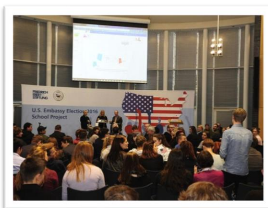
Preisverleihung „US Election Project“